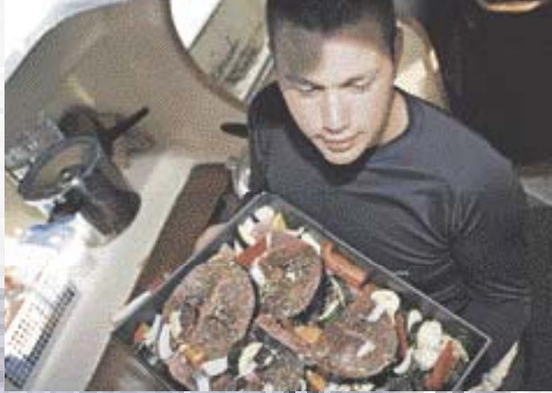
Thunfisch mit Gemüse: Für Leistungsfähigkeit und sonnige Laune ist gutes und ausgewogenes Essen wichtig.