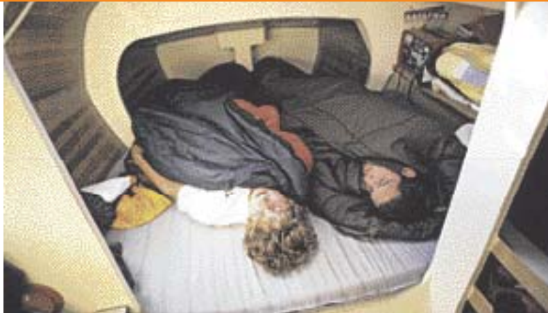
Schlafen: Viel Raum für persönliches Gepäck bleibt in den Doppelkojen nicht.