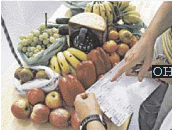
Welche Früchte halten sich im tropischen Klima am längsten? Auseinandersetzung mit der Lebensdauer von Nahrungsmitteln.